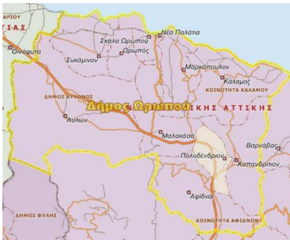
Εικόνα 2.2: Δημοτική Ενότητα Πολυδενδρίου.