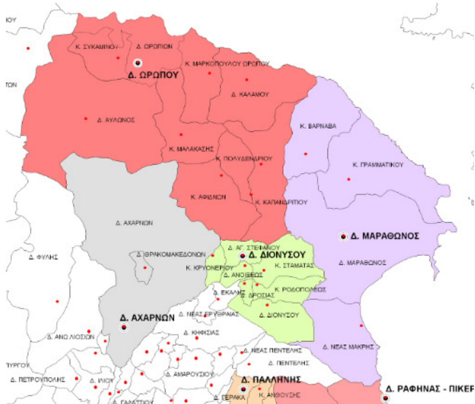
Εικόνα 2.1: Διοικητικά όρια του Καλλικρατικού Δήμου Ωρωπού και των Δημοτικών Ενοτήτων.

Βάσει της νέας διοικητικής μεταρρύθμισης «Νέα Αρχιτεκτονική της Αυτοδιοίκησης και της Αποκεντρωμένης Διοίκησης-Πρόγραμμα ΚΑΛΛΙΚΡΑΤΗΣ» (Ν.3852/2010), η κοινότητα Πολυδενδρίου καταργείται και συνίσταται από τον Δήμο Ωρωπού με έδρα τον Ωρωπό ο οποίος αποτελείται από τους δήμους α. Ωρωπίων β. Αυλώνος γ. Καλάμου και τις κοινότητες α. Συκάμινου β. Πολυδενδρίου γ. Μαρκοπούλου Ωρωπού δ. Μαλακάσης ε. Καπανδριτίου στ. Αφιδνών, οι οποίοι καταργούνται.