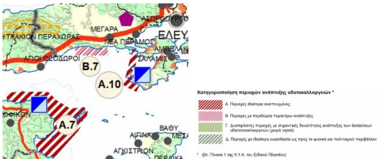
Εικόνα 2: Θέση της εξεταζόμενης μονάδας οστρακοκαλλιέργειας στο χάρτη που συνοδεύει το Ειδικό Πλαίσιο Χωροταξικού Σχεδιασμού και Αειφόρου Ανάπτυξης για τις Υδατοκαλλιέργειες και της στρατηγικής μελέτης περιβαλλοντικών επιπτώσεων αυτού.

Στην εικόνα που ακολουθεί, που αποτελεί απόσπασμα χάρτη του Ειδικού Πλαισίου Χωροταξικού Σχεδιασμού και Αειφόρου Ανάπτυξης για τις Υδατοκαλλιέργειες, αποτυπώνεται η ευρύτερη περιοχή καθώς και η ΠΑΥ (Περιοχή Ανάπτυξης Υδατοκαλλιεργειών) Α.10. «Σαλαμίνα – Μέγαρα». Είναι προφανές ότι η περιοχή μελέτης βρίσκεται εκτός της Π.Α.Υ. Α.10.